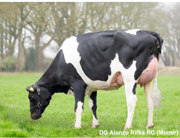
DG Alanzo Rifka RC (Mutter)