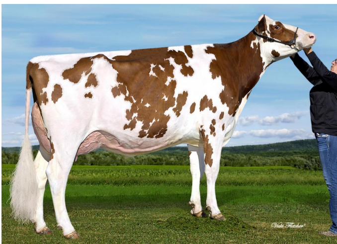
Ms Apple Anara-Red-ET VG-88 (Großmutter)