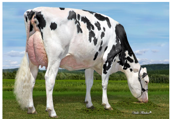
Kcck Artist Ana RC EX-92 (Mutter)