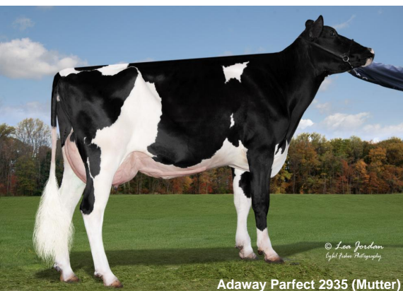
Adaway Parfect 2935 (Mutter)