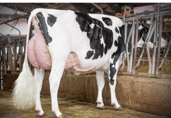
Cristella Kariba VG-85 (Tochter)