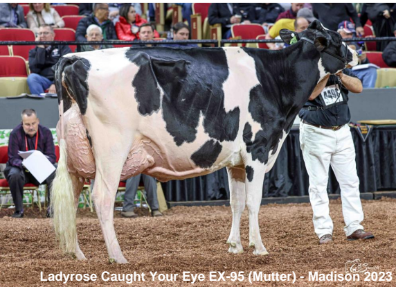
Ladyrose Caught Your Eye EX-95 (Mutter) - Madison 2023