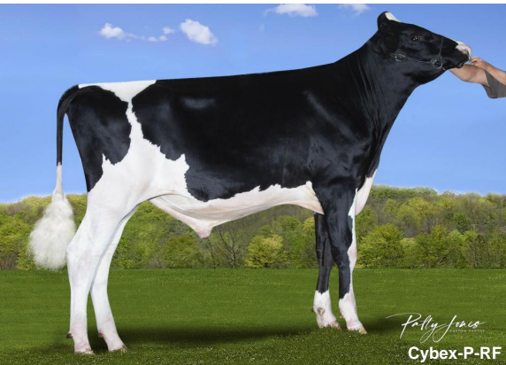
Polly Jones Cybex-P-RF