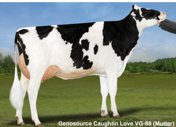
Genosource Caughtin Love VG-88 (Mutter)