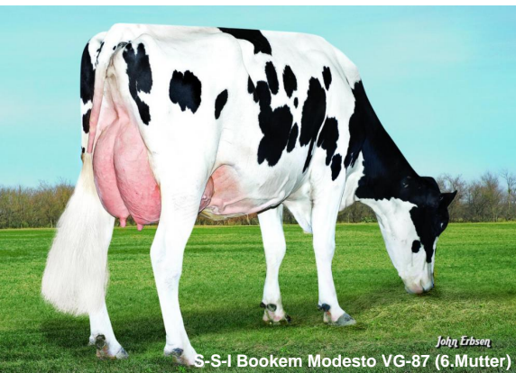
S-S-I Bookem Modesto VG-87 (6.Mutter)