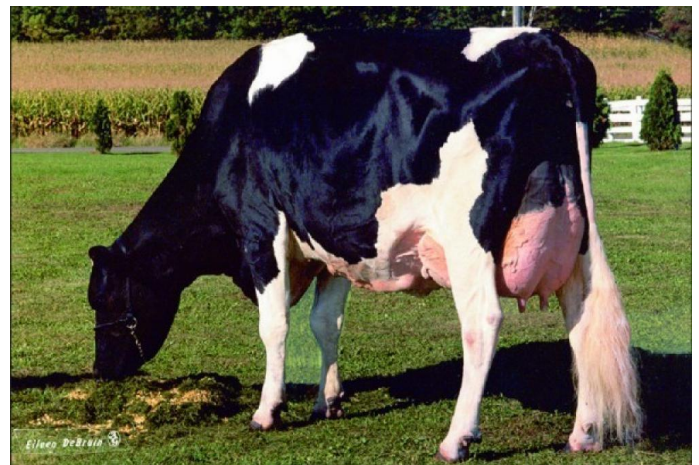
Whittier-Farms Lead Mae EX-95 (Stammkuh)